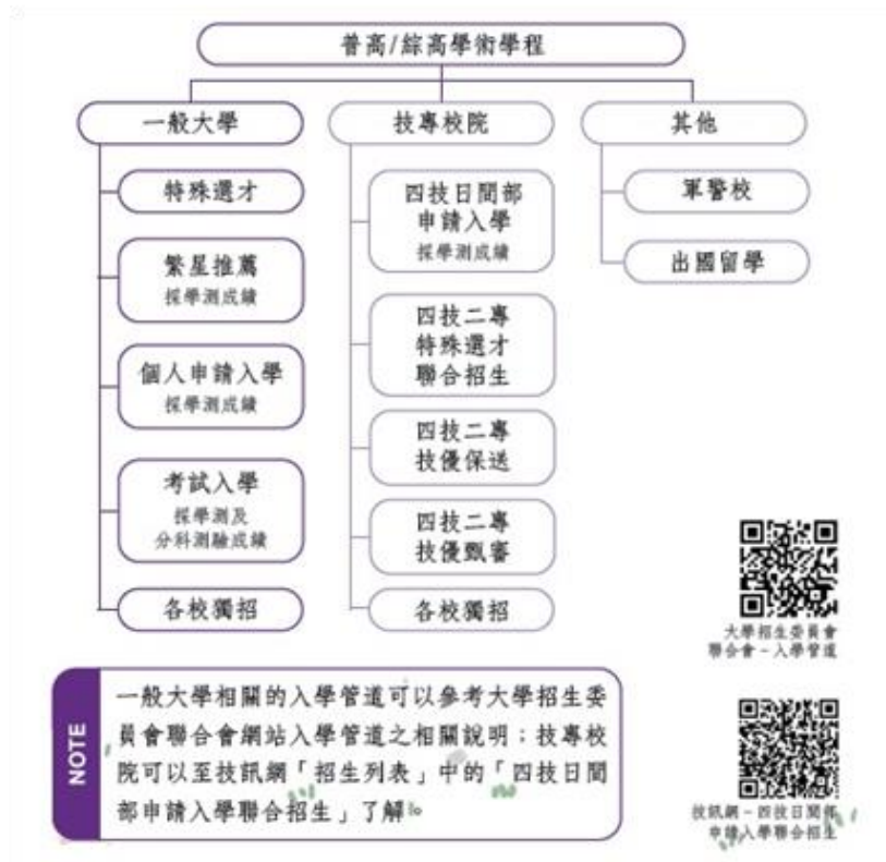
圖 1-普高及綜高學術學程學生的升學管道

有關大學(含專科校院)多元入學方案(111 學年度適用)中，普高及綜高學術學程學生的升學管道參考圖一，技高及綜高專門學程學生的升學管道參考圖二。