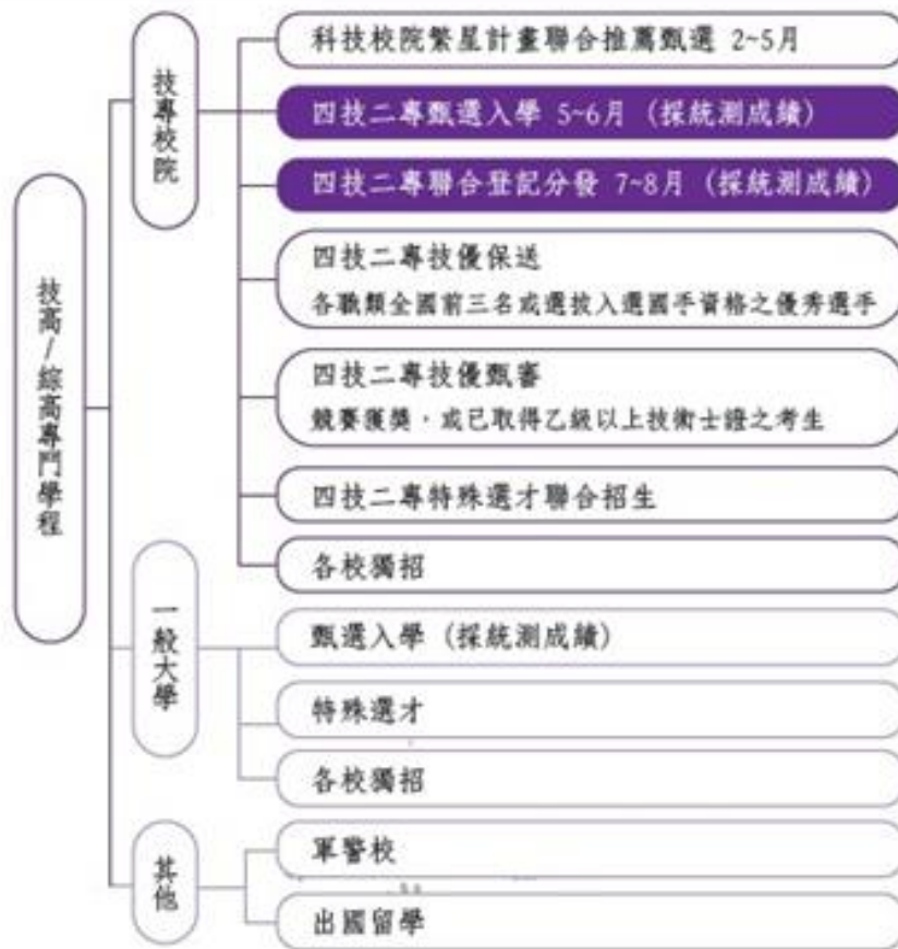
圖 2-技高及綜高專門學程學生的升學管道