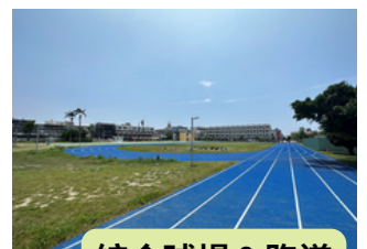
綜合球場 & 跑道

展演台工程於112年3月3日(五)開工，預計於112年8月29日(二)完工。屆時它將成為日後辦理各項典禮活動的最佳舞台。