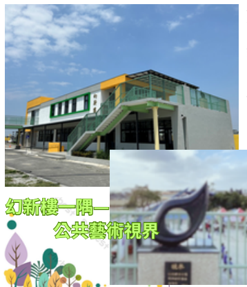
幻新樓一隅—公共藝術視界

完工的幻新樓已於11月10月25日(二)落成啟用，新穎簡約的外觀成為校園中的新焦點，也為學生們提供了更優質的學習環境與設備。