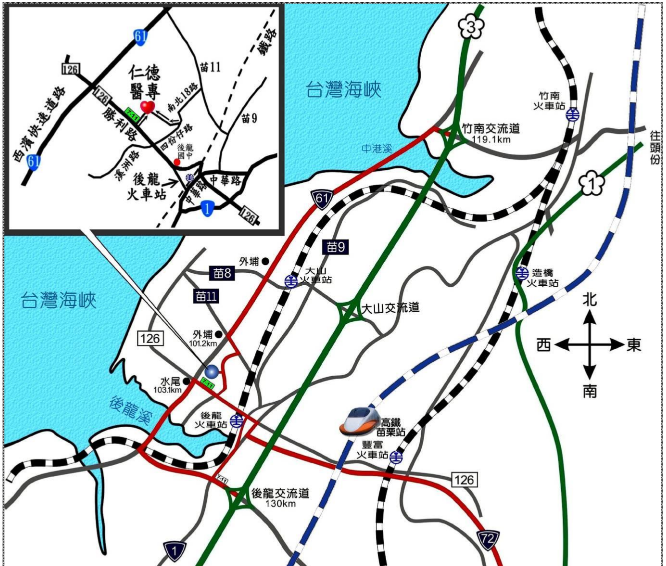
(仁德醫護管理專科學校位置圖)