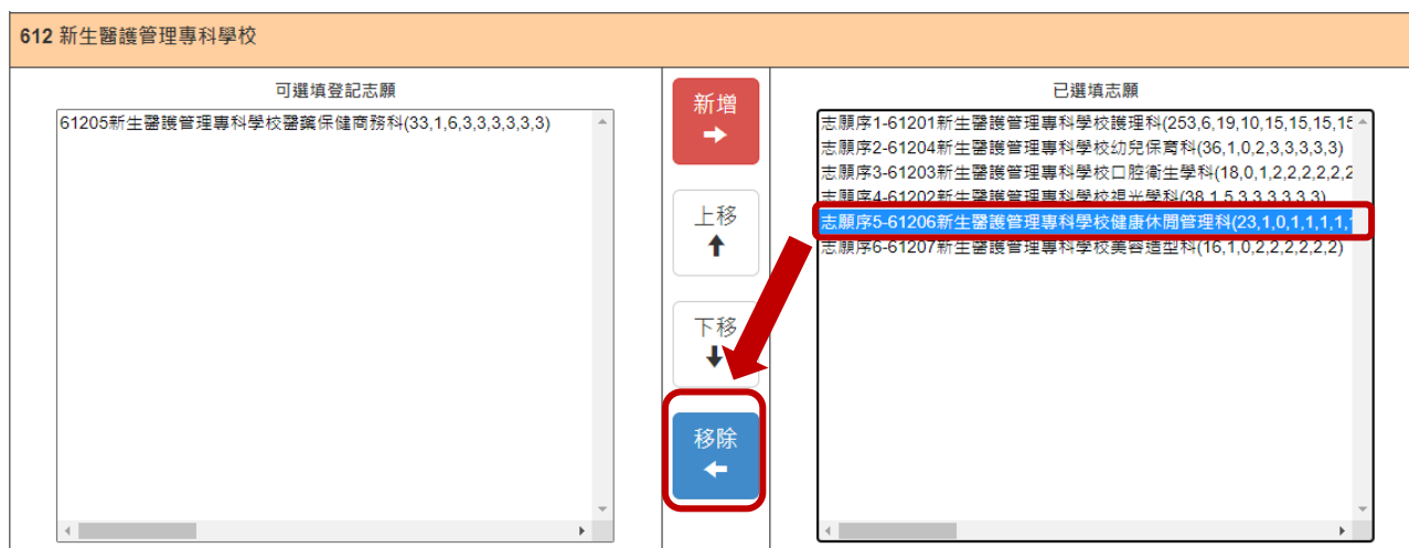
圖13 刪除志願-「移除」按鈕之畫面

移除志願序5-61206新生醫護管理專科學校健康休閒管理科，則選取該志願後，再點選「移除」按鈕即可(如圖13所示)。移除的志願回復在「可選填登記志願」清單(如圖14所示)。