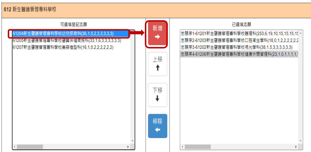
圖6 新增志願之畫面

在「可選填登記志願」清單內，選取欲選填的志願後，點選「新增」按鈕，即會將所選之校科(組)志願加入右方「已選填志願」欄內，如圖 6、圖 7 所示。