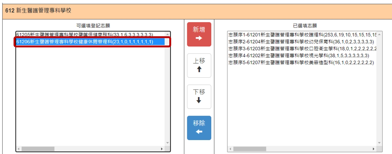
圖14 移除1個志願後「可選填登記志願」清單之畫面