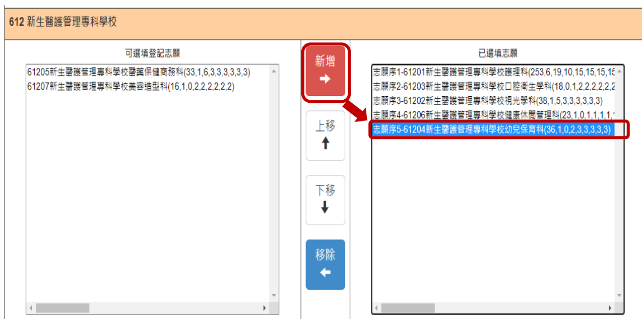
圖7 新增志願後之畫面