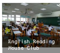
English Reading House Club