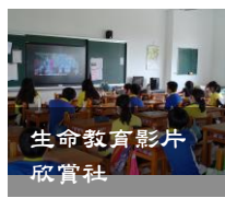
生命教育影片欣賞社