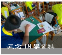
正念 IN 學習社