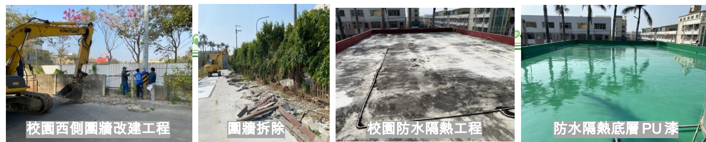
校園西側圍牆改建工程