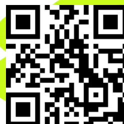
埔鹽國中 E 起加油 APP QR code