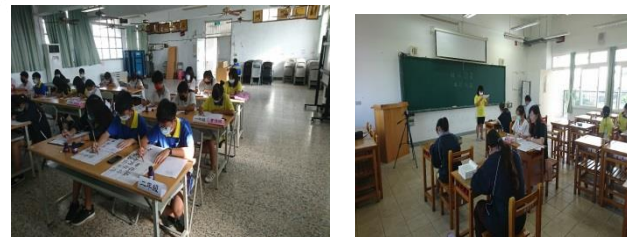
書法、作文、字音字形項目 國語、閩南語朗讀