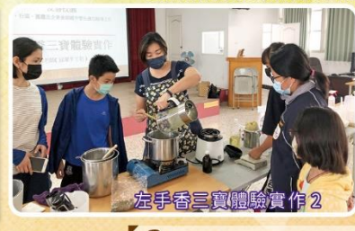
左手香三寶體驗實作 2