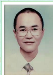
第 12 任家長會長