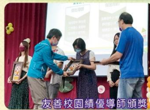
友善校園績優導師頒獎