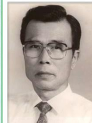
第 8 任家長會長