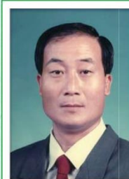
第 14 任家長會長