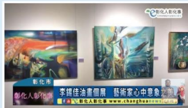
(2022 受邀個展於國立彰化生活美學館 1、2 展廳，媒體採訪報導)