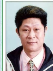
第 20 任家長會長