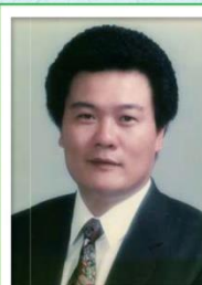
第 11 任家長會長