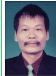
第 19 任家長會長