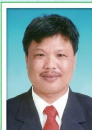
第 22 任家長會長