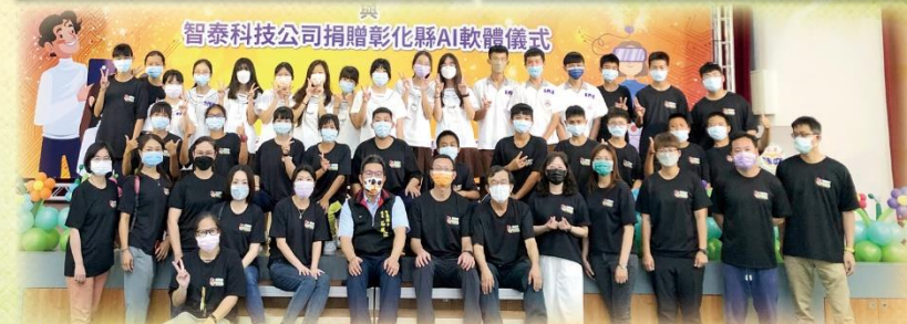
承辦 110 學年度技藝競賽頒獎大合照