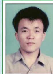
第 16 任家長會長