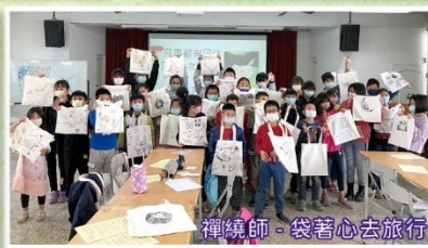
禪繞師 - 袋著心去旅行