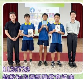
1120728 特教知能暨親職教育講座