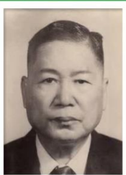
第 2 任家長會長