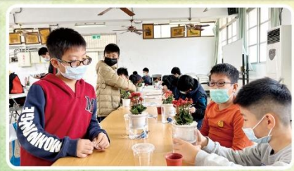
生活美學創意植栽DIY