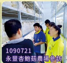
1090721 永豐杏鮑菇農場參訪