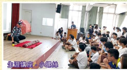
生涯講座 - 小銀絲