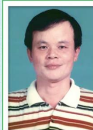
第 15 任家長會長