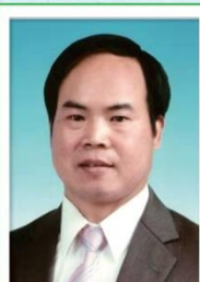
第 21 任家長會長