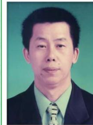
第 18 任家長會長