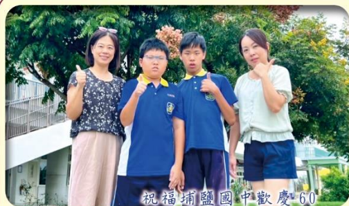
鹽中60，風華甲子，明日看我，再創高鋒