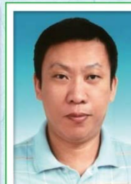
第 24 任家長會長