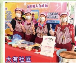
大有社區 參加技藝競賽社區成果展