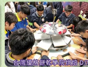
台灣優格餅乾學院烘焙DIY