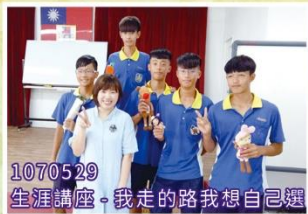
1070529 生涯講座-我走的路我想自己選