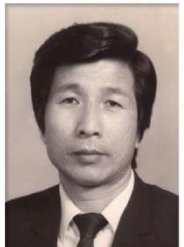
第 6 任家長會長