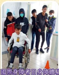
國際身障者自身障礙體驗