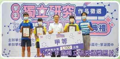
1111 年度獨立研究頒獎照片