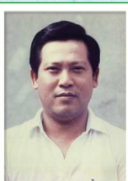
第 9 任家長會長