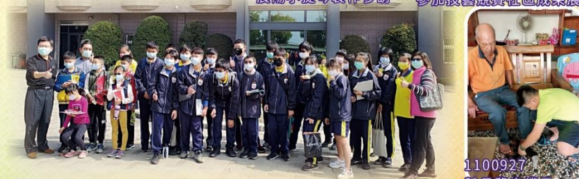
1100126 晨陽興業參訪實作