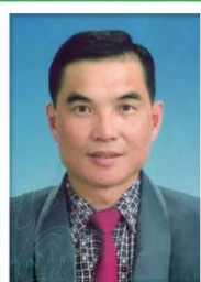
第 13 任家長會長