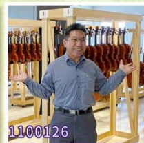
1100126 晨陽小提琴製作參訪