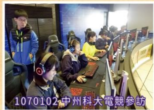
1070102 中州科大電競參訪