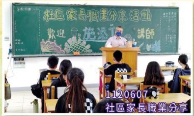
1120607 社區家長職業分享