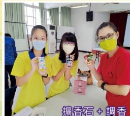
擴香石 + 調香