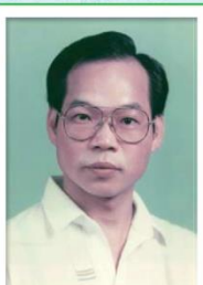
第 10 任家長會長