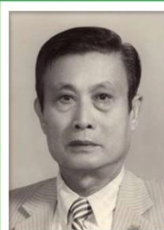
第 3 任家長會長