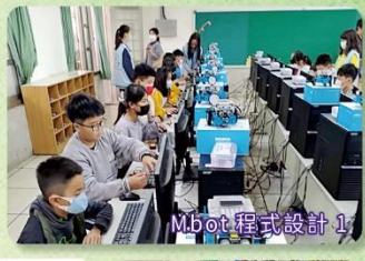
Mbot 程式設計 1