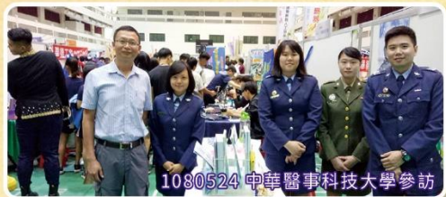
1080524 中華醫事科技大學參訪