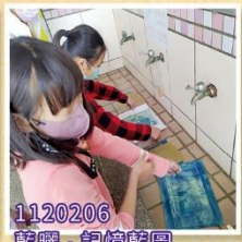
1120206 藍曬 - 記憶藍圖