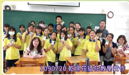
1090720 乾燥花插花教學實作