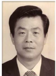
第 5 任家長會長