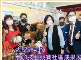
大聖雞毛擲 參加技藝競賽社區成果展