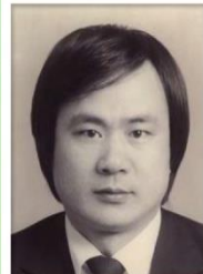
第 7 任家長會長