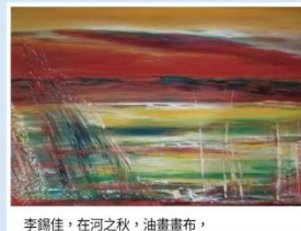
李錫佳，在河之秋，油畫畫布， (李錫佳油畫近作 50 號油畫秋岸)