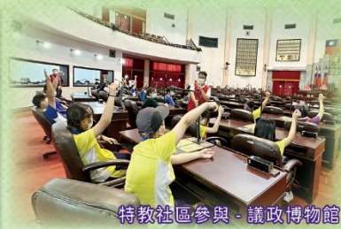
特教社區參與 - 議政博物館