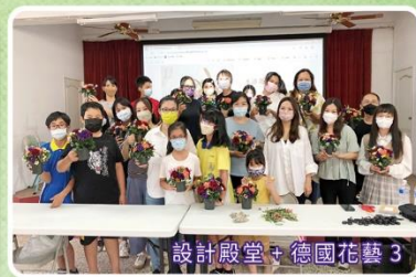
設計殿堂+德國花藝3