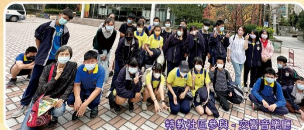
特教社區參與 - 交響音樂廳