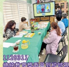
1120311 總統教育獎委員到校訪視