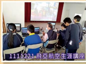
1111221-飛亞航空生涯講座