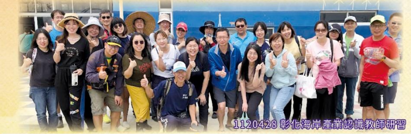
1120428 彰化海岸產業認識教師研習