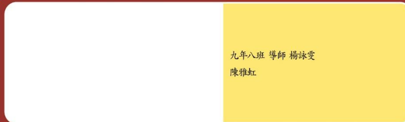
九年八班 導師 楊詠雯 陳雅虹