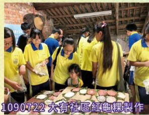
1090722 大有社區紅龜粿製作