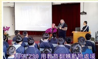
10911230 用教育翻轉動物處境