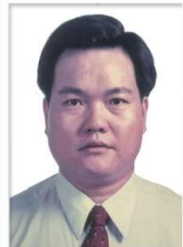
第 17 任家長會長