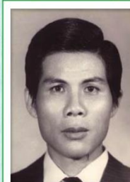
第 4 任家長會長