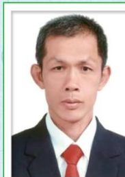
第 23 任家長會長