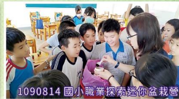
1090814 國小職業探索迷你盆栽營