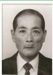
第 1 任家長會長