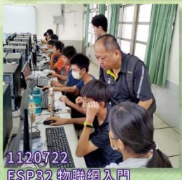
1120722 ESP32 物聯網入門